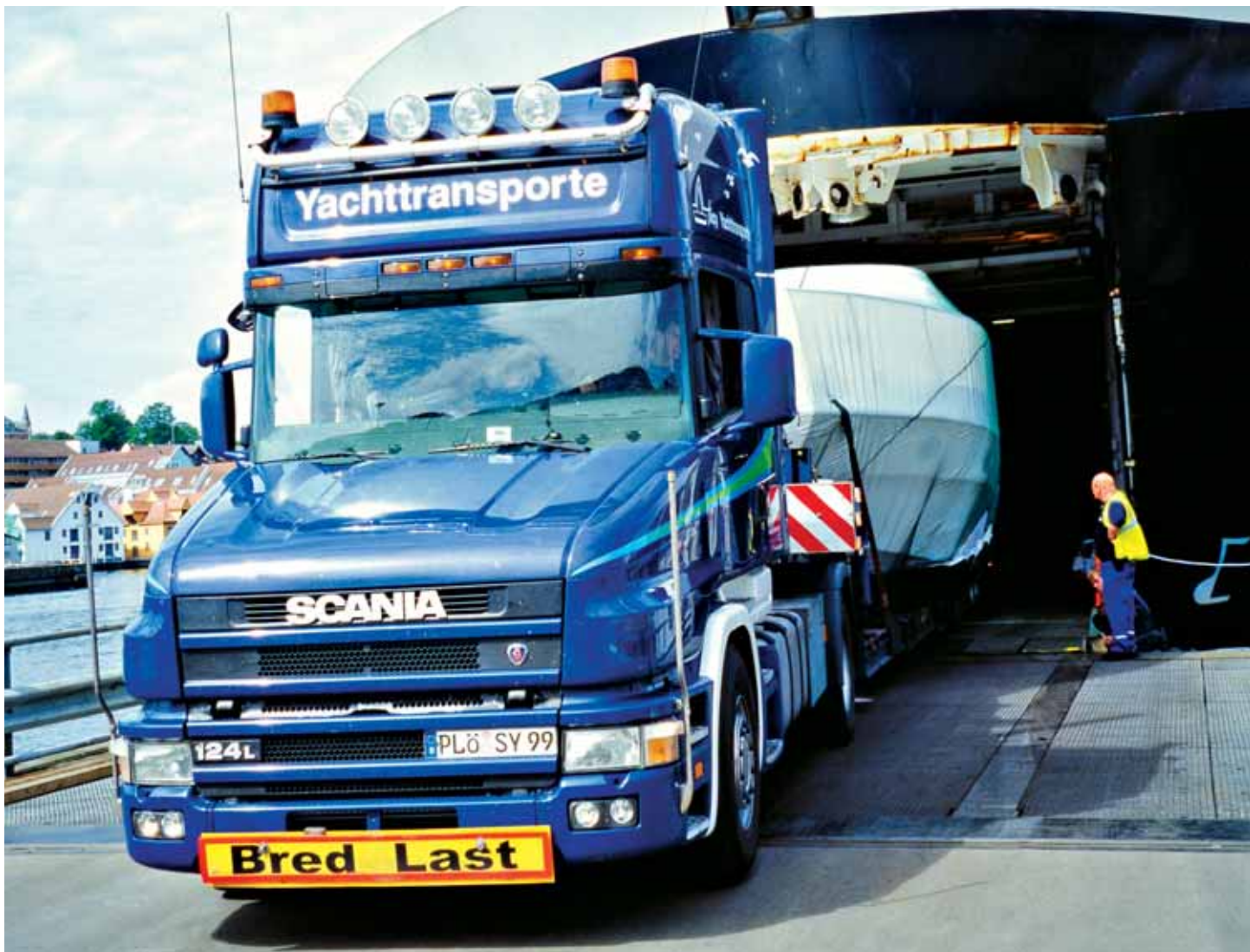
Maßarbeit: Der überdimensionale Transport verläßt die Fähre von Dänemark nach Norwegen.