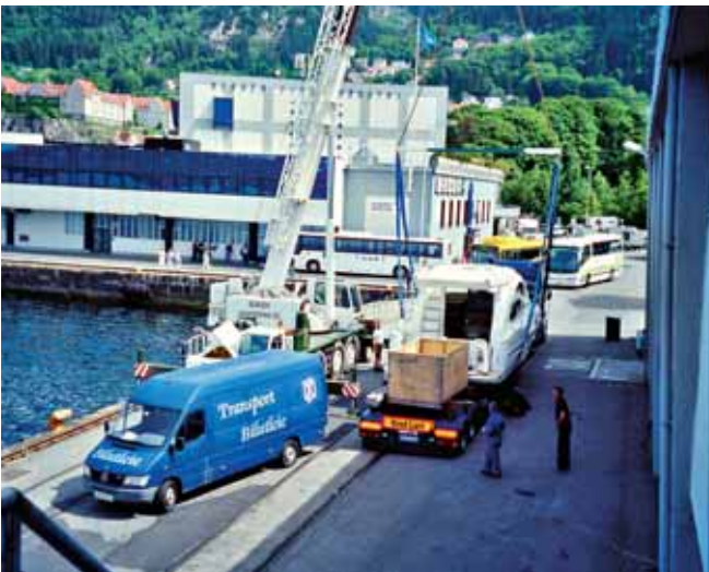
Firmenfarben: Das typische Blau der Sleepy-Trucks ist in vielen Häfen ein gewohnter Anblick.