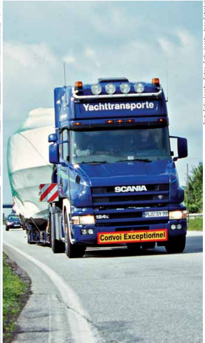
Text: Felix Jacoby

für Ingo Schinkel schon Routine, denn dank häufiger Fahrten zum Mittelmeer sind ihm die meisten vorgeschriebenen Strecken bestens vertraut.