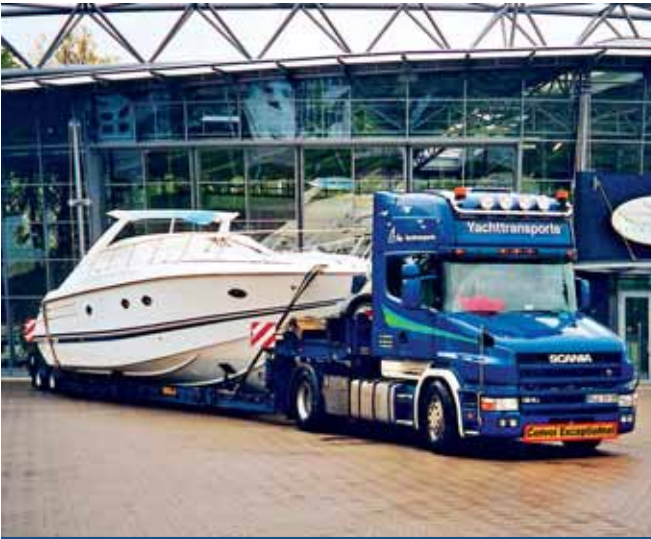
Repräsentation: Die Messen sind große Treffpunkte.