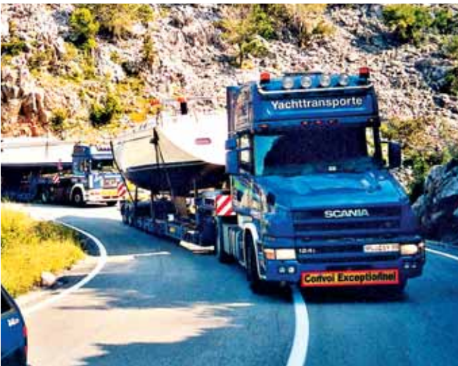
Navigation: Fahrer von übergroßen Sondertransporten müssen oft schwierige Strecken absolvieren.