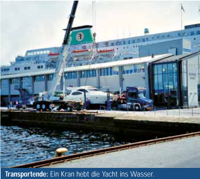
Transportende: Ein Kran hebt die Yacht ins Wasser.